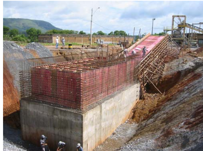
Paulino Patrus, 2011